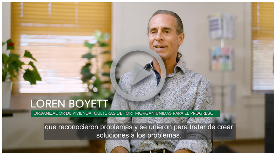
Fort Morgan, Colo.