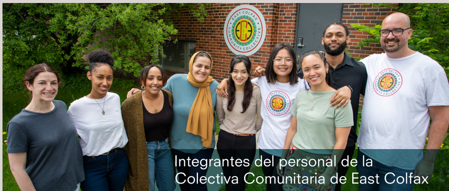
Integrantes del personal de la Colectiva Comunitaria de East Colfax